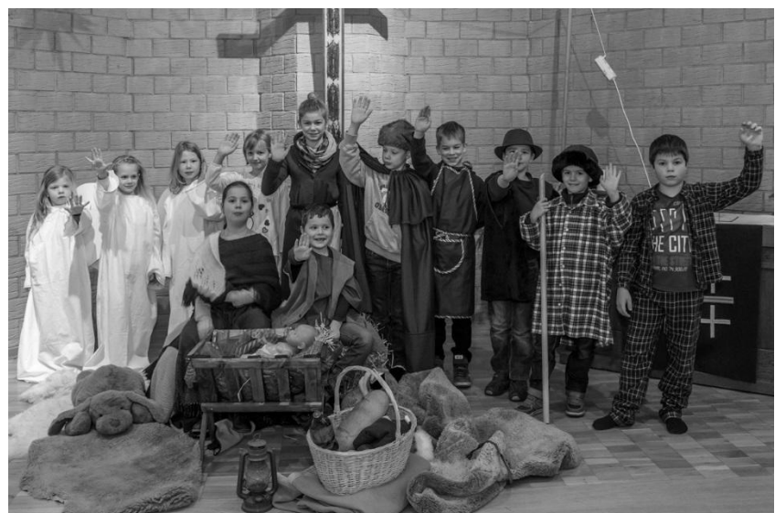
Im Kirchenzentrum Lohne führten letztes Jahr viele Kinder mit Begeisterung ein Krippenspiel auf.